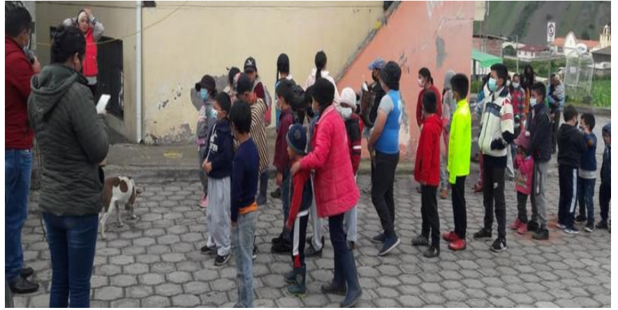
Gestión de kits de protección en SNGR y entrega a los moradores de la parroquia Ilapo