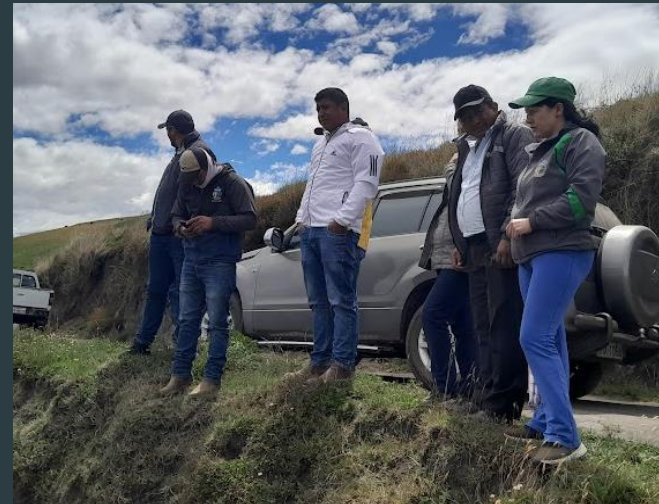
Recorridos de campo para verificar coordenadas