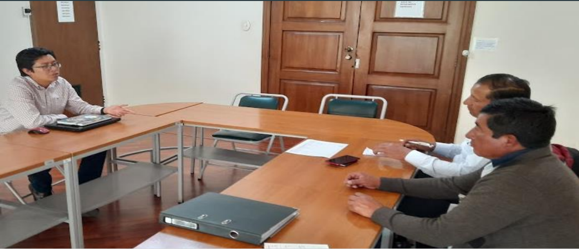
Asesoría para la modificación de límites en el ministerio de Gobierno en Quito