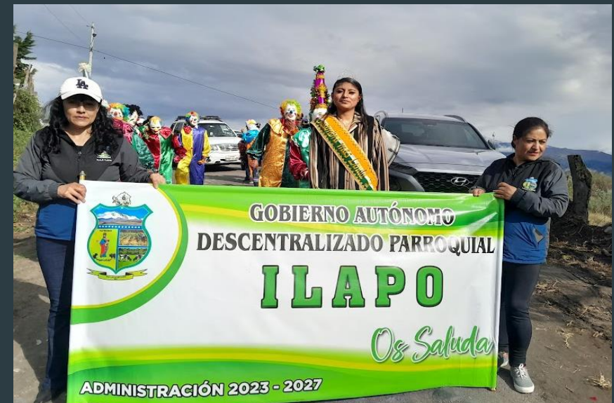
PARTICIPACIONES CON DELEGACIONES EN EVENTOS CULTURALES DE LOS GADS