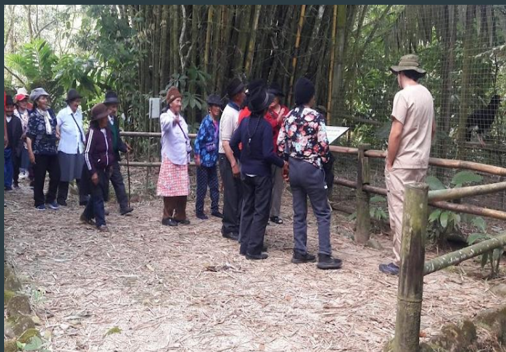
Visita del Zoológico "El Arca"