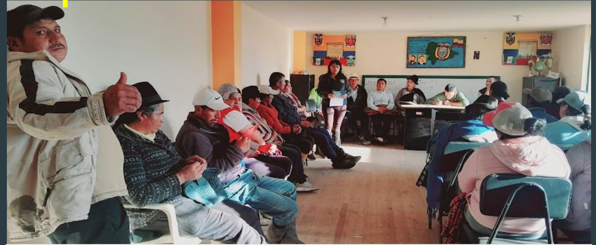
Socialización sobre la modificación de límites en la comunidad Saguazo La Unión