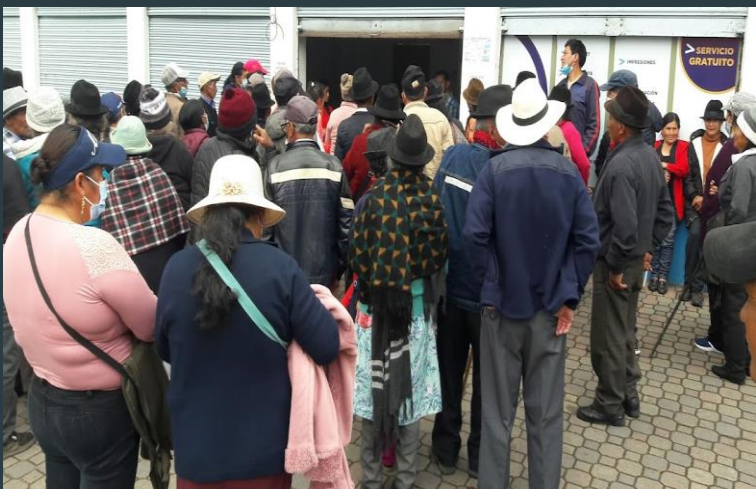
Visita al Punto del encuentro del Cantón baños