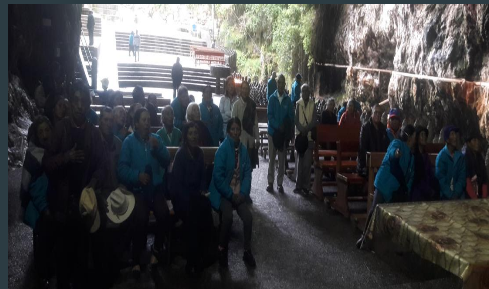
Visita el santuario "Gruta de la Paz"