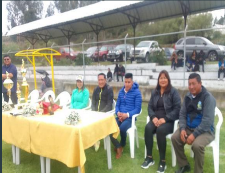
EN ENCUENTRO DEPORTIVO DEL CONAGOPARE CHIMBORAZO