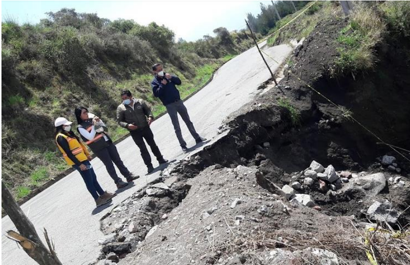
Atención de emergencia vial y coordinación de trabajos de mantenimiento vial con maquinaria del GADPCH