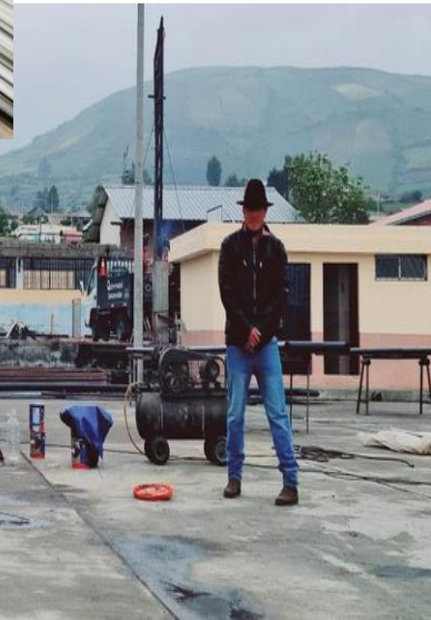
Reunión de trabajo para aprobar la continuidad de la obra